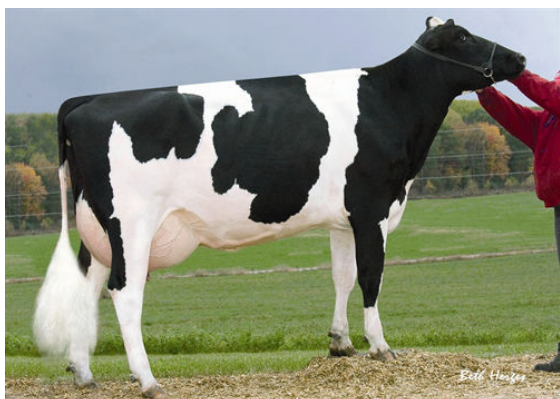
SANDY-VALLEY BOLT SHEILA FIFTH DAM